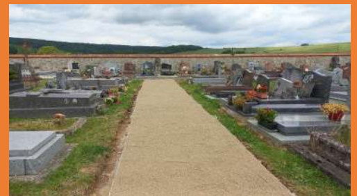
Réfection des allées centrales